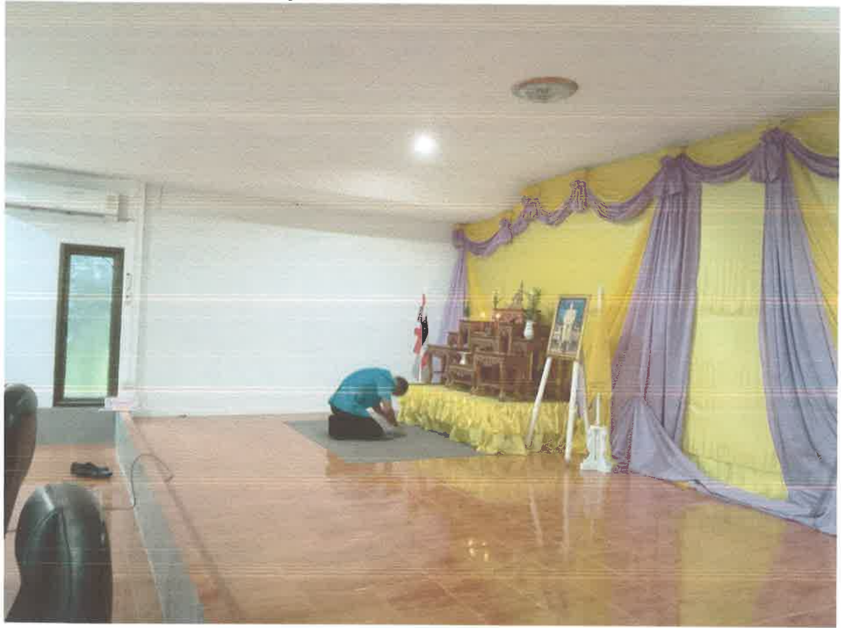
ภาพประกอบการประชุมสภาองค์การบริหารส่วนตำบลเหล่าต่างคำ สมัยสามัญที่ ๓ ประจำปี ๒๕๖๓ ครั้งที่ ๔/๒๕๖๓