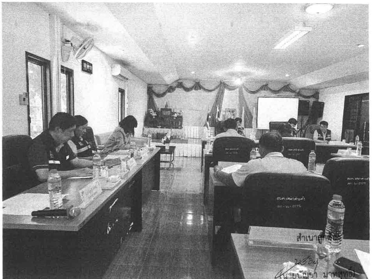
ประธานสภาองค์การบริหารส่วนตำบลเหล่า