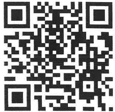
โอนงบประมาณ