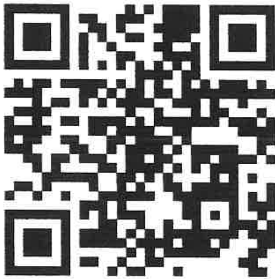
บันทึกถอนสภาพ