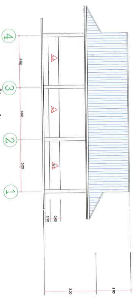
ด้านหลัง 3 1:100