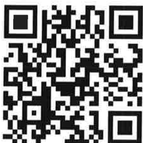
เอกสารแนบ ข้อ ๖.๑