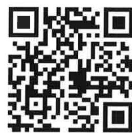
เอกสารแนบ ข้อ ๑.๖